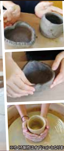
※ぐるぐる制作はオプションとなります

地域固有の歴史・風土に根ざして受け継がれてきた様々な伝統・風習・文化などが存在し、このような地域の歴史的魅力や特色は、有形・無形の文化財として受け継がれています。これらの文化財によって日本の文化や伝統を物語る「ストーリー」を国が認定したものが「日本遺産」です。